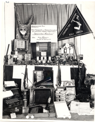
Sprzęt konspiracyjny przejęty przez niemiecką policję