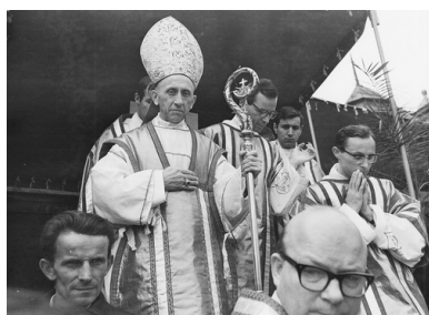
Arcybiskup Antoni Baraniak w otoczeniu księży w czasie mszy na murach Jasnej Góry w pierwszą rocznicę uroczystości millenijnych