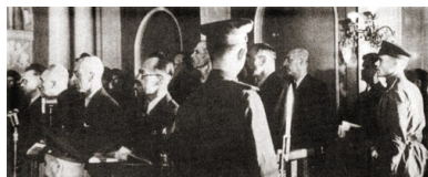
Ława oskarżonych w procesie Szesnastu, Moskwa, czerwiec 1945 r.

Jak z tego wynika, wiosną 1945 r. Churchill walczył ze Stalinem o niezawisłą Polskę – acz w nowym kształcie terytorialnym i bez legalnego rządu polskiego 18 . Sojusznikiem Anglika w tej walce miał być Mikołajczyk. Churchill zrobił wszystko, by przełamać sowiecki opór przeciwko jego zaproszeniu do Moskwy, co miało umożliwić polskiemu politykowi niedopuszczenie do powstania Tymczasowego Rządu Jedności Narodowej zdominowanego przez komunistów.