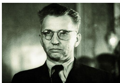
Gen. Okulicki przed Kolegium Wojskowego Sądu Najwyższego ZSRS

Niedługo później razem z Bieniem w celi nr 63 osadzono innych skazanych działaczy podziemia – wicepremiera Jana Stanisława Jankowskiego (skazanego na 8 lat) oraz ministrów Stanisława Jasiukiewicza i Antoniego Pajdaka (obu z wyrokami po 5 lat pozbawienia wolności). Obok, w oddzielonej cienką drewnianą ścianą celi nr 62, przetrzymywano tylko jednego skazańca. Więźniowie robili wszystko, aby ustalić jego tożsamość.