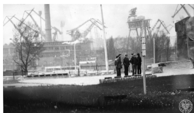
Plac przy pomniku Grudnia 1970 w Gdyni (po prawej stronie widoczny jest fragment pomnika). W tle zabudowania żurawie w stoczni im. Komuny Paryskiej, 1 maja 1982 r.