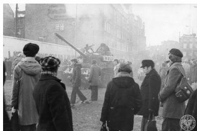
Ulice Gdańska w grudniu 1981 r.