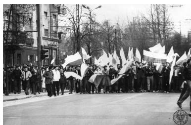
Czoło manifestacji idącej w dniu 1 maja 1982 r. w Gdyni (prawdopodobnie na ul. 10 lutego).