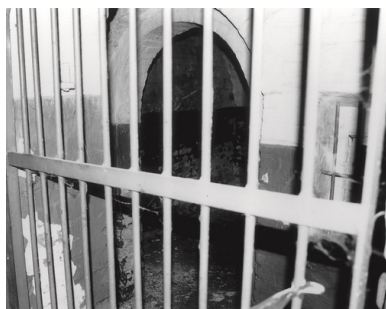
Cela w Forcie VII, w której 6 stycznia 1940 r. strażnicy dokonali masakry przedstawicieli elity wielkopolskiej - widok obecny.

Następnie odbywał się apel. Wachman wchodził do celi, wszyscy stawali na baczność, starsza celi składała raport o stanie obecnych. Następnie kończyło się porządkowanie celi, jak np. mycie podłogi. Była ona z cegieł. O godz. 12 był obiad, o 18 kolacja.