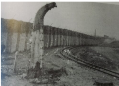
Słup narożny i mur ogrodzenia zewnętrznego. Okres po likwidacji obozu w 1956 r.