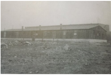
Barak warsztatów obozowych. Okres po likwidacji obozu w 1956 r.