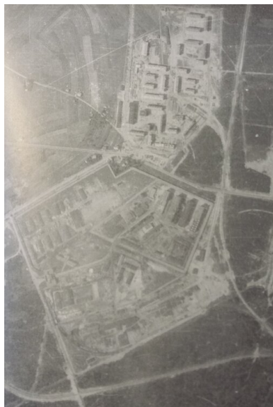
Zdjęcie lotnicze terenu obozu w Jaworznie z 1953 r..

wykonywali więźniowie zatrudnieni w obozowej fabryce, gdzie produkowano elementy betonowe. Najpierw ręcznie przygotowywali masę betonową, a kiedy elementy były już wyschnięte, ładowali je na wagony kolejowe. Dzienna norma wynosiła 23 tony na osobę. Lżej nieco mieli ci, którzy pracowali w stolarni, gdzie produkowano skrzynki do amunicji i broni, przy pracach ślusarskich, w kuchni lub kartoflarni.