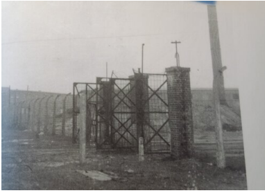
Brama wewnętrzna obozu w Jaworznie bezpośrednio po likwidacji obozu w 1956 r.