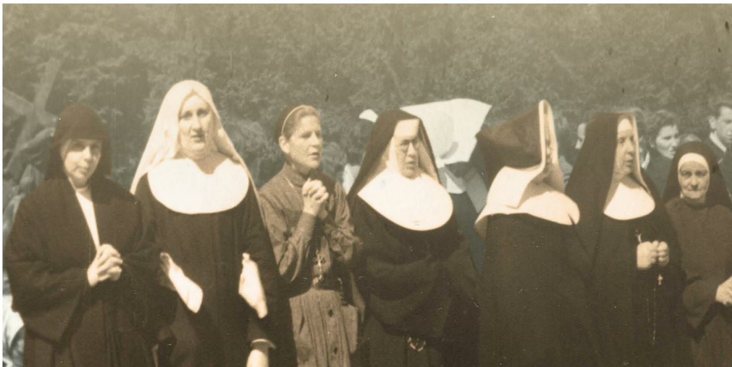
Fot. z wystawy IPN „Trudne lata – wielkie dni. Zakony żeńskie w PRL”

https://przystanekhistoria.pl/pa2/tematy/represje/68430,Zakonnice-na-wygnaniu.html