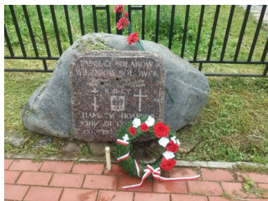
Tablica „Pamięci Polaków więźniów Sołówek - rodacy”

To największe wzniesienie na Wielkiej Sołowieckiej. W tutejszej cerkwi pod wezwaniem Wniebowstąpienia Pańskiego, pełniącej zarazem funkcję latarni morskiej, NKWD urządziło karcer. Zsyłano tu ludzi za ucieczki, nieposłuszeństwo i przestępstwa pospolite. Jedną z metod egzekucji było przywiązywanie więźniów do drewnianej kłody i strącanie ze stromych, liczących 365 stopni schodów – ginęli w niewypowiedzianych męczarniach. Zimą przywiązywano skazańców do pnia drzewa i oblewano wodą, latem wystawiano nagich na żer komarom. U podnóża Siekierniej Góry rozstrzeliwano uwięzionych. W trakcie badań archeologicznych przeprowadzonych w 2006 r. odnaleziono w tym miejscu 126 ludzkich szkieletów. Miejsc kaźni było o wiele więcej, większość nadal nie jest zlokalizowana. Dziś wiadomo o masowych mordach na Wyspach w 1923, 1929 oraz w 1937 r.