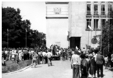
Demonstracja przed gmachem KW PZPR w Radomiu.