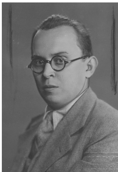
Konstanty Grzybowski - prawnik, profesor Uniwersytetu Jagiellońskiego. Fotografia portretowa.

Zalecono również przeprowadzenie wywiadu w miejscu zamieszkania oraz założenie podsłuchu telefonicznego oraz inwigilację korespondencji.