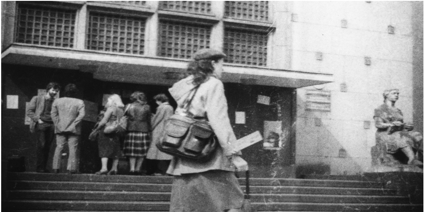
Obserwacja grupy osób przy wejściu do budynku Wydziału Filologicznego Uniwersytetu Śląskiego na ul. Bando obecnie ul. Żytnia w Sosnowcu.

https://przystanekhistoria.pl/pa2/tematy/represje/76889,Czerwone-slaskie-uczelnie.html