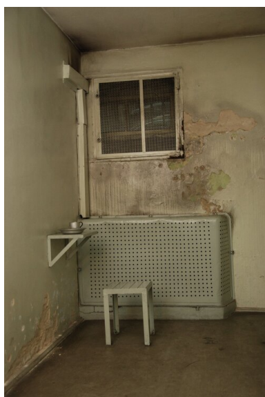
Areszt w KM MO w Katowicach przy ul. Kilińskiego, stan z 2011