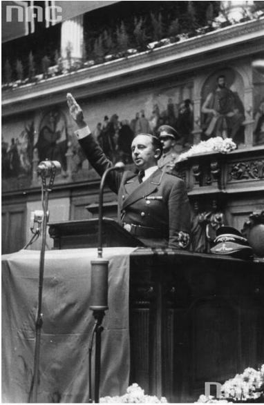
Harodove Arthivum Cyfrowe, sygn. 2-2701