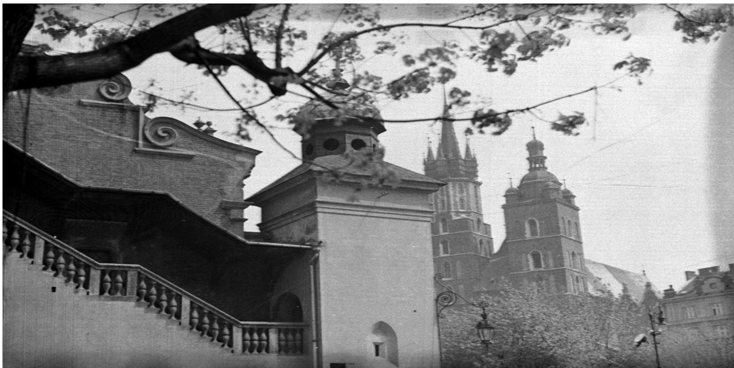
Fragment Sukiennic, a w tle widoczny kościół Mariacki w Krakowie.

https://przystanekhistoria.pl/pa2/tematy/represje/81106,3-maja-1946-roku-w-Krakowie.html