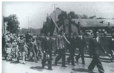
Czołówka pochodu idąca spod Akademii Górniczej na krakowskich Alejach Trzech Wieszczów, 3 maja 1946 r. Fot.

Po rozpędzeniu manifestacji UB przeprowadził masowe aresztowania studentów, m.in. w II Domu Akademickim, czyli dzisiejszym „Żaczku”. Zatrzymano około tysiąca osób. Poważniejszymi zajściami zakończyły się też próby świętowania 3 maja m.in. w Łodzi, Gliwicach i Włocławku.