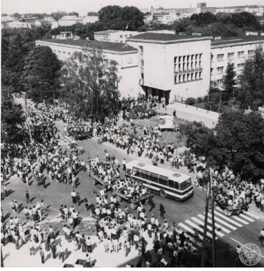
Radom, demonstracja przed gmachem KW PZPR podczas Czerwca`76.