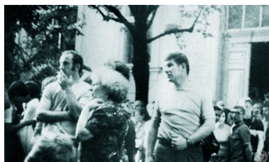
Demonstracja przed siedzibą KW PZPR w Płocku, czerwiec 1976.

W dziejach PRL podwyżki lub zapowiedzi podwyżek cen podstawowych artykułów żywnościowych często prowadziły do tzw. niepokojów społecznych w postaci strajków i demonstracji ulicznych, zaś te ostatnie – w momencie prób ich pacyfikacji przez MO – łatwo przeradzały się w zamieszki. Nie inaczej stało się 25 czerwca 1976 r., nazajutrz po sejmowym wystąpieniu ówczesnego premiera Piotra Jaroszewicza, w którym ten de facto zapowiedział rychły wzrost cen wielu podstawowych artykułów żywnościowych (cukier, mięso, ryby, masło, sery, produkty zbożowe, warzywa, owoce) o co najmniej kilkadziesiąt, a nawet o ponad 100 procent. Prowokacyjną cechą „projektu”, który 25 czerwca miał rzekomo zostać poddany „konsultacjom społecznym”, był także niekorzystny dla obywateli o niższych dochodach system rekompensat. Mimo starannego pod względem propagandowym przygotowania przez władze PRL „operacji cenowo-dochodowej”, co miało oswoić Polaków z tezą o jej konieczności z powodów ekonomicznych, nazajutrz po przemówieniu Jaroszewicza doszło do burzliwych „konsultacji społecznych”.