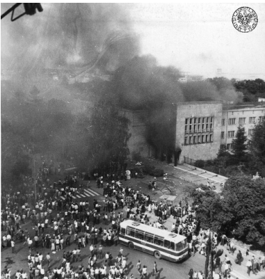
Czerwiec`76: płonący budynek