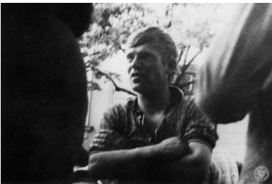
Przed siedzibą KW PZPR w Płocku: 1976, czerwiec.