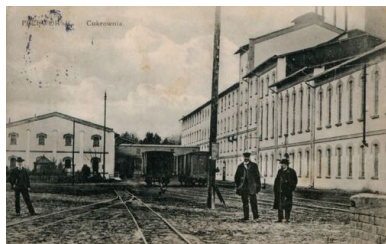
Cukrownia w Przeworsku przed 1939 r.