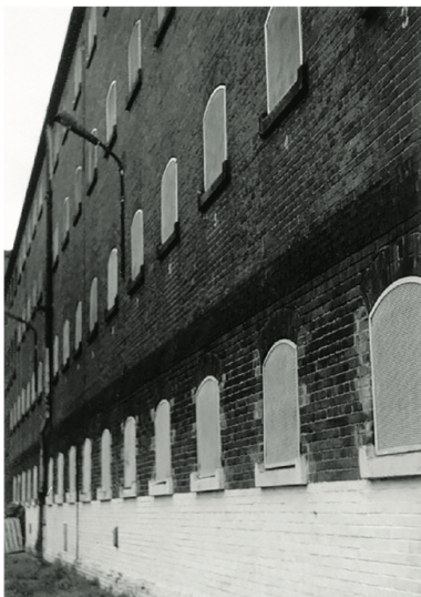
Więzenie przy ul. Kleczkowskiej 31 we Wrocławiu

W roku 1956 rozpracowanie obiektowe „Radwan” zostało rozbite na pojedyncze sprawy ewidencyjno-obszaryjne. Bezpieka PRL nadal, w miejscach zamieszkania i pracy, inwigilowała oficerów i żołnierzy lwowskiej AK, jednak już w ramach indywidualnych rozpracowań.