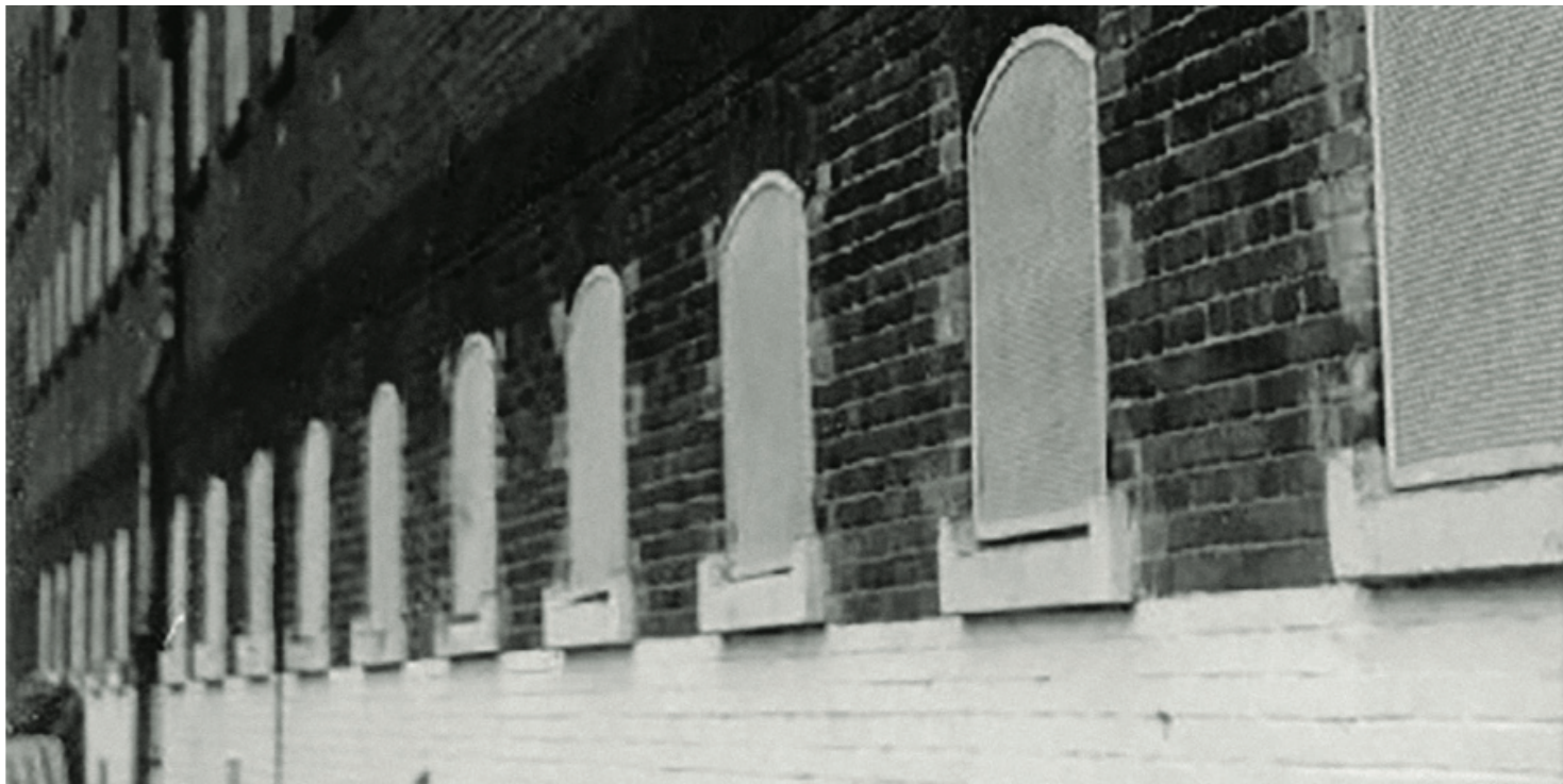
Więzienie przy ul. Kleczkowskiej 31 we Wrocławiu

https://przystanekhistoria.pl/pa2/tematy/represje/86795,Eksterytorialny-Okreg-Lwowski-AK-WiN-i-jego-rozbitcie-przez-bezpieke.html