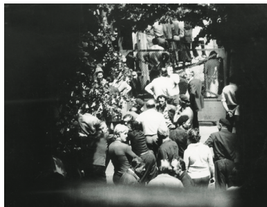
Zdjęcie uczestników protestu robotników w Radomiu wykonane przez SB z tzw. punktu zakrytego, 25 VI 1976 r.

Wypełnianie pierwszej funkcji polegało na fizycznej eliminacji osób i środowisk uznanych za zagrożenie lub potencjalne zagrożenie dla partii; drugiej – na zdobywaniu wiedzy o osobach, środowiskach i zjawiskach (trendach, procesach społecznych) traktowanych przez komunistów jako niebezpieczne bądź ważne dla funkcjonowania reżimu; trzeciej – na ochronie partii przed niepożądanymi zjawiskami i działaniami; czwartej zaś – na wywieraniu zakulisowego, niejawnego wpływu na rzeczywistość. Ostatnia funkcja była usługowa wobec represyjnej i profilaktycznej.