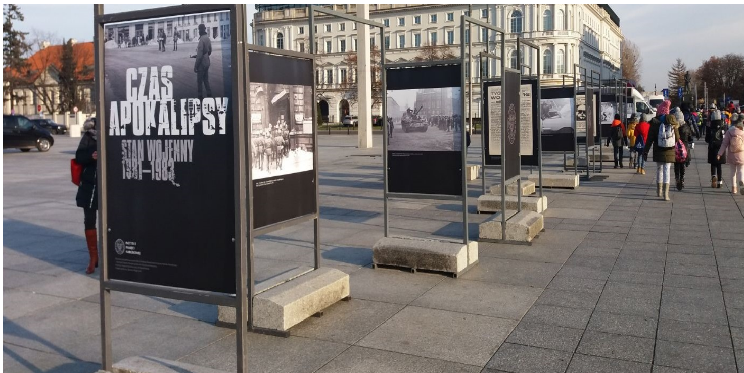
Wystawa „Czas apokalipsy. Stan wojenny 1981-1983” na placu Piłsudskiego w Warszawie, 2019 r.

https://przystanekhistoria.pl/pa2/tematy/represje/87983,Internowanie-kobiet-w-stanie-wojennym.html