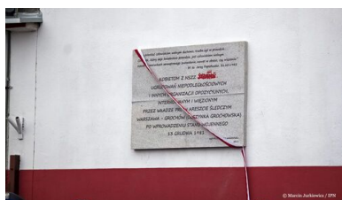
Tablica poświęcona kobietom internowanym i osadzonym w Areszcie Olszynka Grochowska, 2017 r.