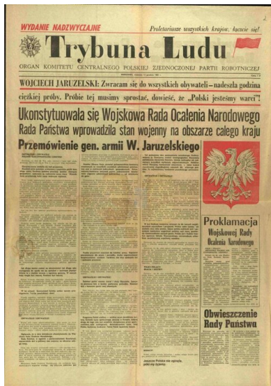
Nadzwyczajne wydanie „Trybuna Ludu” z 13 grudnia 1981 r.