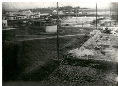
Obóz w Żabikowie.

ponieśli tutaj liczni członkowie polskiego podziemia z Kraju Warty oraz kilkunastu żołnierzy AK z Inowrocławia.