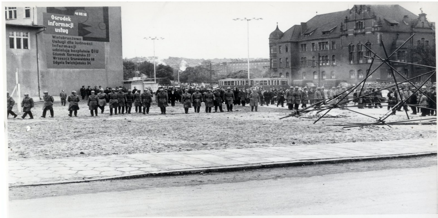
Interwencja ZOMO (AIPN)

https://przystanekhistoria.pl/pa2/tematy/represje/91934,Pierwsza-proba-sil-w-Gdansk-Obchody-Milenium-Chrztu-Polski-nad-Motlawa.html