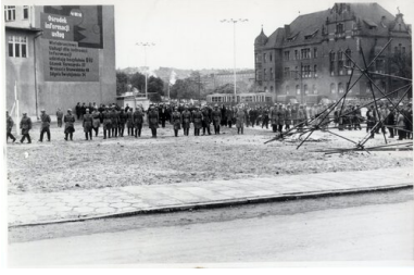
Interwencja ZOMO (AIPN)