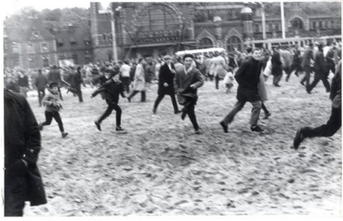
Ucieczka przed ZOMO