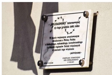
Tablica pamiątkowa na ścianie aresztu śledczego Kielce-Piaski, 2021 r.

368 internowanych, w tym 354 mężczyzn i 14 kobiet. W kolejnych tygodniach część osób zwalniano, kobiety przewożono do innych ośrodków, głównie w Gołdapi. Według przybliżonych danych, łączna liczba internowanych, którzy przez krótszy bądź dłuższy okres przebywali na „Piaskach”, to prawie 900 osób.