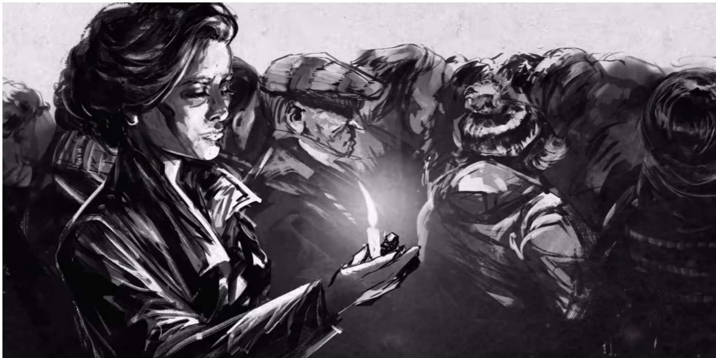
Kadr z filmu IPN Światło Wolności

https://przystanekhistoria.pl/pa2/tematy/represje/97611,Boze-Narodzenie-w-osrodku-odosobnienia-Kielce-Piaski.html