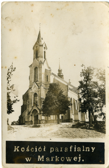
Kościół parafialny w Markowej (ze zbiorów krewnych rodziny Ulmów)