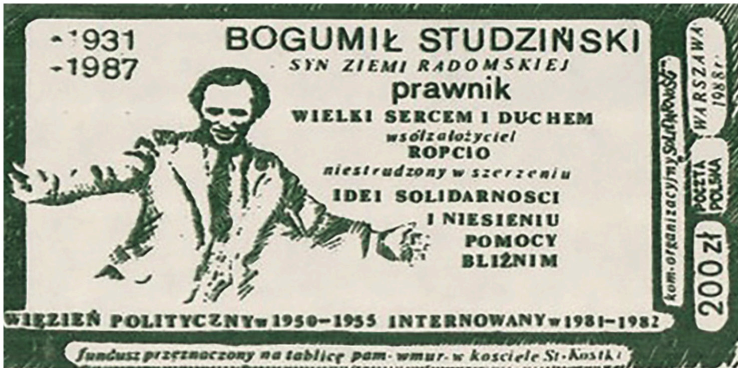
Cegielka kolportowana przez Solidarność w 1988 r.

https://przystanekhistoria.pl/pa2/tematy/ropcio/98238,Wspoltworca-ROPCiO-Bogumil-Studzinski-19311987.html