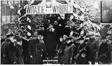
Wejście do lokalu wyborczego w Sanoku, 19 I 1947 r.

Według oficjalnych danych PPR i jej satelici uzyskali 80,1 proc. głosów przy zaledwie 10,3 proc. PSL-u. „Wybory to taka szkatułka: wchodzi Mikołajczyk – wychodzi Gomułka” – powtarzali ci, którzy nie mieli wątpliwości, co działo się 19 stycznia.