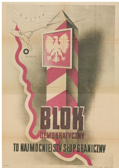
Plakat wyborczy tzw. Bloku Demokratycznego