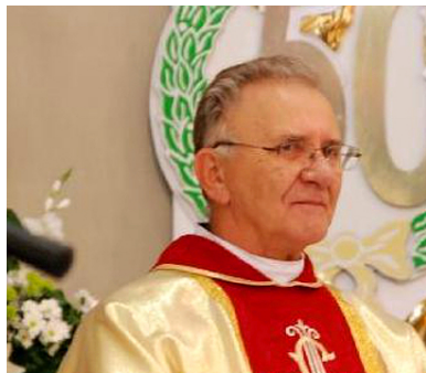
Ksiądz Stanisław Bartmiński

Na Rzeszowszczyźnie wybuchł największy w PRL protest polskich chłopów, którego kulminacją były strajki w Ustrzykach Dolnych (29 grudnia 1980 – 20 lutego 1981 r.) i Rzeszowie (2 stycznia 1981 – 19 lutego 1981 r.). Zakończyły się one podpisaniem porozumień, w których władza komunistyczna akceptowała „celowość wzmocnienia gwarancji nienaruszalności” pozostającej we władaniu chłopów ziemi. Ukoronowaniem konsolidacji środowisk chłopskich było zarejestrowanie 12 maja 1981 r. NSZZ „Solidarność” RI.