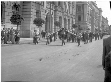
Członkowie Stronnictwa Narodowego podczas defilady z okazji Święta Żołnierza w Krakowie, sierpień 1937 r.

Specyficzne podejście wśród środowisk narodowych reprezentowało najmłodsze pokolenie narodowców, w tym Ruch Narodowo-Radykalny „Falanga” Bolesława Piaseckiego, który wywodził się z Obozu Narodowo-Radykalnego. Głoszona przez niego wizja ustroju miała łączyć najlepsze zdobycze państwa sanacyjnego z tradycją obozu narodowego. Oznaczało to państwo narodowe i etatystyczne, zarządzane przez silny ośrodek z silnym przywódcą – wodzem – na czele. Pozostałe nurty narodowe, SN i ONR (Organizacja Polska), przez cały okres II RP pozostawały na pozycjach antysanacyjnych.