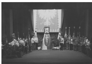
Poczty sztandarowe pełniące straż przy portrecie Romana Dmowskiego na tle godła Polski na scenie Teatru imienia Stanisława Wyspiańskiego w Katowicach, 1939 r.

Zabójstwo prezydenta było podwójną tragedią – jako śmierć głowy państwa i jako przejaw zepsucia systemu demokratycznego, opartego na docieraniu stanowisk. Tymczasem dla części ludzi z elektoratu narodowców Eligiusz Niewiadomski – morderca Narutowicza – stał się bohaterem narodowym. Kryzys związany ze śmiercią prezydenta niewątpliwie obciąża obóz narodowy.