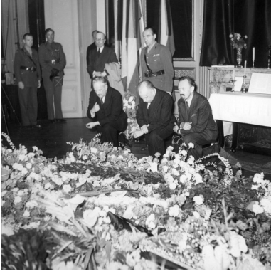
Składanie wieńców przez delegację Stronnictwa Narodowego podczas uroczystości pogrzebowych w Londynie po śmierci gen. W. Sikorskiego, lipiec 1943 r.