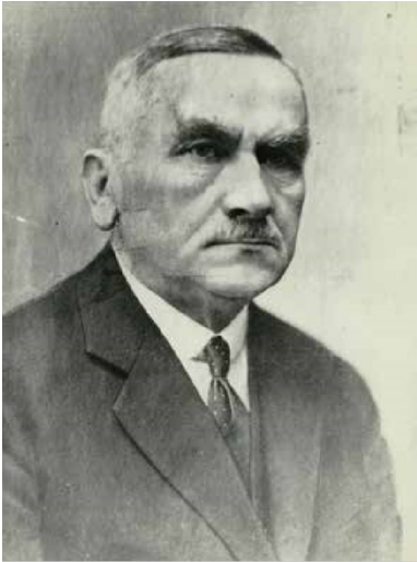
Roman Dmowski.