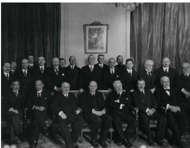
Roman Dmowski (stoi piąty od lewej) na konferencji wersalskiej,