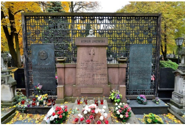
Grób Romana Dmowskiego, cmentarz Bródnowski w Warszawie.