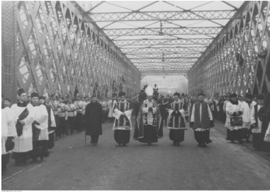
Pogrzeb Romana Dmowskiego w Warszawie w 1939 r.