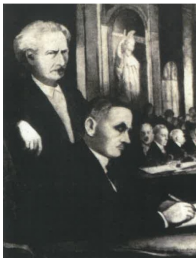
Moment złożenia podpisu przez Romana Dmowskiego pod traktatem wersalskim ("Przewodnik Katolicki" 1929, nr 28)

Zabiegając o korzystne dla Polski rozstrzygnięcia, Roman Dmowski wystosował dwie noty do przewodniczącego Komisji do spraw Polskich Julesa Cambona. Pierwsza z nich datowana na 28 lutego dotyczyła granicy zachodniej, druga, z 3 marca 1919 r. – granicy wschodniej. 12 marca 1919 r. komisja ogłosiła sprawozdanie, w którym uwzględniono niemal wszystkie postulaty strony polskiej odnośnie do przebiegu granicy zachodniej. Zapowiadano jedynie przeprowadzenie plebiscytu na terenie Mazur. 15 marca ustalenia zatwierdził Centralny Komitet Terytorialny. Raport ten spotkał się jednak z bardzo krytyczną oceną brytyjskiego premiera Davida Lloyd George'a, który stwierdził, iż nie uwzględniono w nim oczekiwań i argumentów strony niemieckiej. Przeciwwstawiał się wówczas, jak się okazało skutecznie, przekazaniu Polsce Gdańska, co było jednym z głównych postulatów strony polskiej. Nie ulega wątpliwości, że szef brytyjskiej dyplomacji chciał zapobiec nadmiernemu osłabieniu Niemiec, które z punktu widzenia Wielkiej Brytanii stanowiły istotny czynnik zapewniający równowagę sił na kontynencie europejskim.