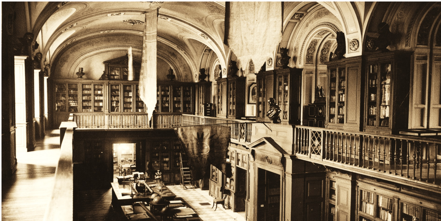
Biblioteka Ordynacji Zamojskich przed 1939 r.

https://przystanekhistoria.pl/pa2/tematy/ruch-narodowy/75898,Zapomniany-mecenas-odrodzonej-Rzeczypospolitej-Maurycy-Zamoyski-18711939.html