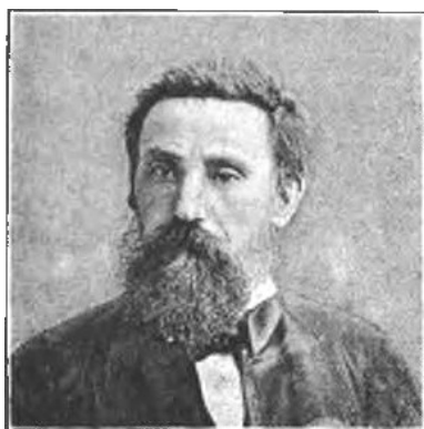
Portret Bolesława Limanowskiego z książki „Upominek. Książka zbiorowa na cześć Elizy Orzeszkowej (1866-1891)”

Oznaczało to wysunięcie na plan pierwszy postulatu walki o niepodległość.