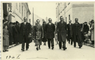
Maszeruje PPS. Z zasobu IPN

Ostatecznie kwestia stosunku PPS do jakiegokolwiek formy uczestnictwa w jednolitofrontowej inicjatywie komunistów została uregulowana podczas XXIV Kongresu socjalistów w Radomiu (31 stycznia–2 lutego 1937 r.). Ostatni w dziejach II Rzeczypospolitej Polski Zjazd PPS w kwestii komunistycznej powielił w przyjętej platformie politycznej partii zapisy rezolucji Rady Naczelnej PPS z listopada 1936 r. dotyczące negatywnego stosunku do Kominternu. W ciągu kilku miesięcy zapadły kolejne decyzje potwierdzające stanowisko władz kongresowych. Najpierw w październiku 1937 r. w Warszawie zaakceptowała je partyjna konferencja, a następnie, odrzucając możliwość jakiegokolwiek kooperacji z komunistami, potwierdziła je listopadowa RN PPS.