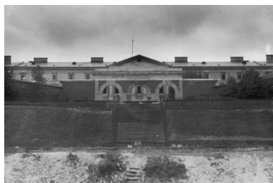
Warszawa, Cytadela. Widok