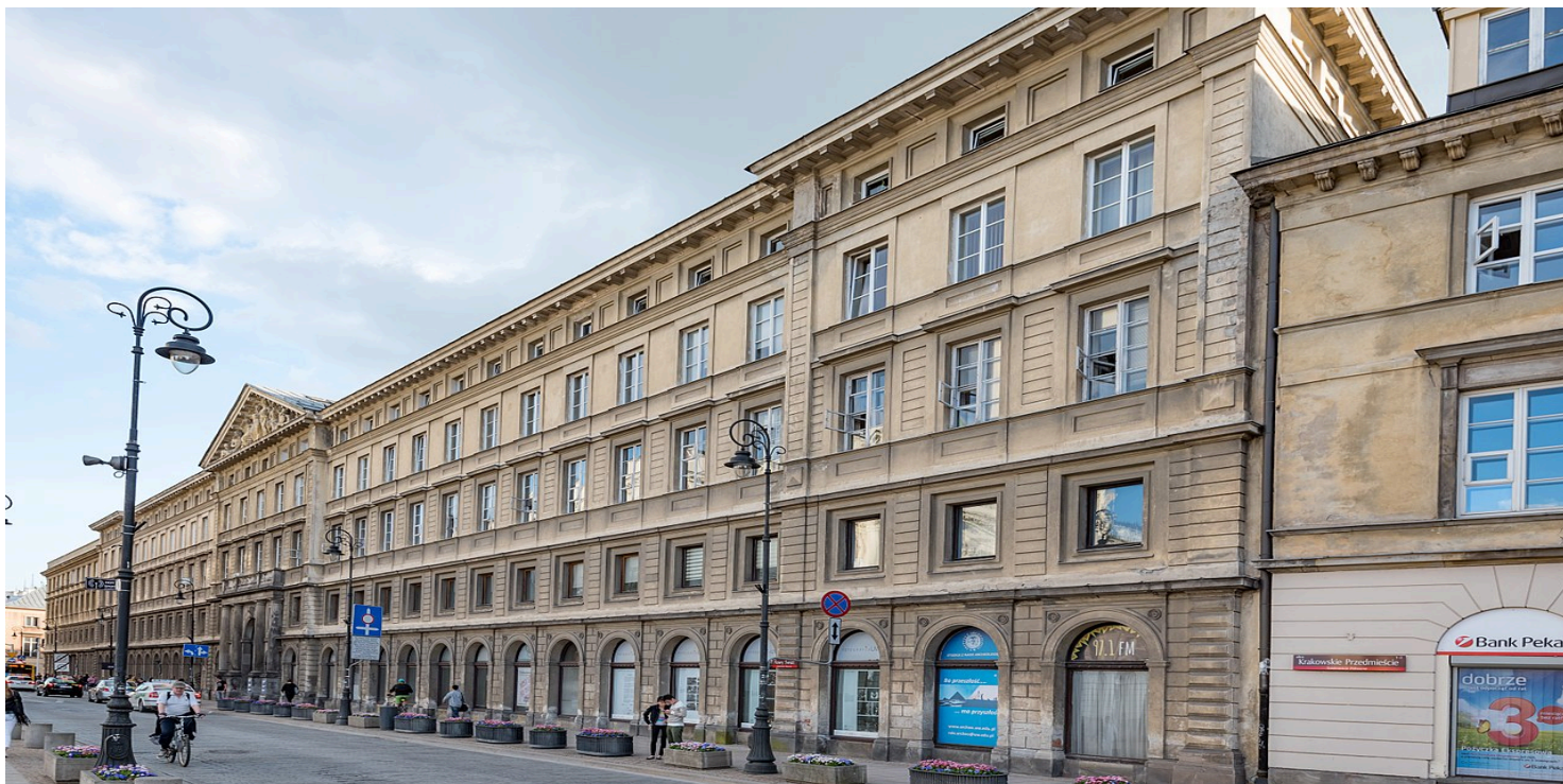
Pałac Zamoykich w Warszawie. W tym budynku przed wojną mieścił się resort spraw wewnętrznych. Widok obecny

https://przystanekhistoria.pl/pa2/tematy/sanacja/64098,Stanislaw-Michalowski-wzor-urzednika-II-RP.html