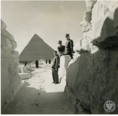
Żołnierze Samodzielnej Brygady Strzelców Karpackich na tle piramidy Chefrena w Gizie, luty 1941. Fot. z zasobu IPN (z „Kolekcji Karola Angermana” przekazanej przez Ewę Krystynę Jędruch)