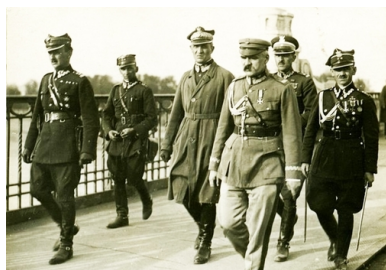
Józef Piłsudski w otoczeniu najbliższych współpracowników na moście Poniatowskiego, 12 maja 1926 r.

Zdecydowanie, w skali kraju, ożywiło się również budownictwo mieszkaniowe. Na wsi zaś znacznie wzrosło tempo parcelacji. Rosły, innymi słowy, pokłady społecznej nadziei.