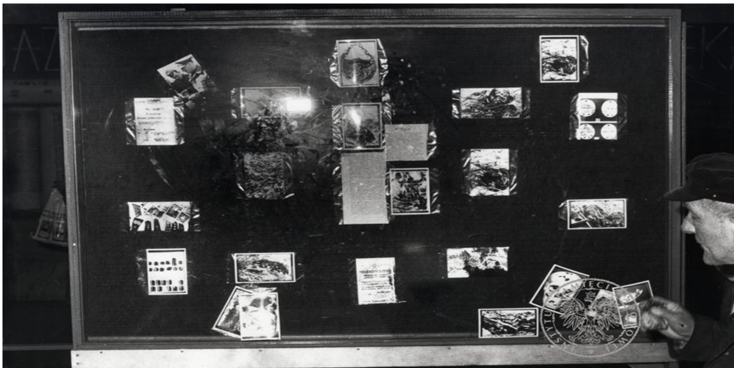
Dworzec kolejowy w Poznaniu. Gablota, w której „Solidarność” umieściła materiały związane z mordem katyńskim. Fotografia wykonana przez funkcjonariuszy SB (z zasobu IPN)

https://przystanekhistoria.pl/pa2/tematy/solidarnosc/100056,NSZZ-Solidarnosc-a-Zbrodnia-Katynska.html