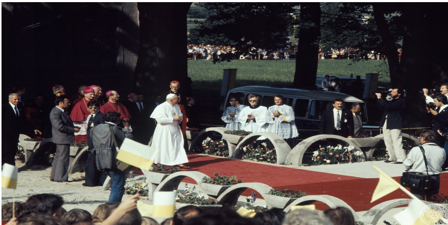
Jan Paweł II przed rozpoczęciem niesporów maryjnych na Górze Świętej Anny, 21 VI 1983 r.

https://przystanekhistoria.pl/pa2/tematy/solidarnosc/102442,Przywrocenie-nadziei.html