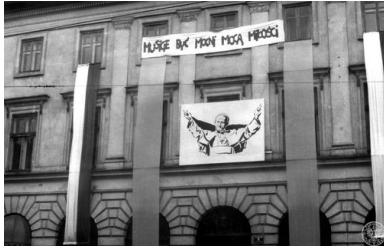
Kraków. Klasztor Zgromadzenia Księży Misjonarzy (widok od strony ul Stradomskiej), 18 VI 1983 r. (fot. z zasobu IPN)

Tekst stanowi fragment książki „Dawniej to było. Przewodnik po historii Polski” (2019) Całość publikacji dostępna w wersji drukowanej w księgarni internetowej ksiegarniaipn.pl