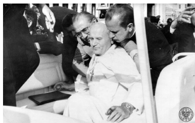
Zamach na papieża Jana Pawła II.

W maju opisywany tu trend był trudno dostrzegalny, przesłoniły go bowiem dwa, niezwykle dramatyczne, wydarzenia. Do pierwszego z nich doszło 13 maja, w Rzymie. Turecki terrorysta, Ali Agca, dokonał wówczas zamachu na życie Jana Pawła II. Nie zastanawiano się wówczas, kto mógł pokierować uzbrojoną ręką mordercy, choć nikt nie miał w gruncie rzeczy wątpliwości, kto z udanego zamachu odniósłby korzyść. W całej Polsce wypełniły się natomiast kościoły, w których celebrowano msze w intencji powrotu Ojca Świętego do zdrowia. Napięcie, wywołane obawami o stan zdrowia papieża, zamieniło się w głęboki smutek po śmierci kardynała Wyszyńskiego (28 maja). Nastrój żałobny mieszał się z obawą, czy miejsce Prymasa Tysiąclecia, z którego autorytetem liczyć się musieli rządzący, zajmie ktoś, kto okaże się równie niezastąpionym mediatorem i moralnym przewodnikiem społeczeństwa. Ostatecznie w pierwszej dekadzie lipca następcą zmarłego prymasa został biskup Józef Glemp.