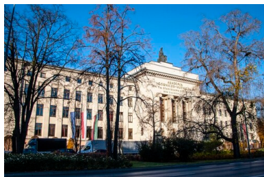
Gmach Akademii Górniczo Hutniczej w Krakowie, 2021 r.

socjalne, takie jak przydział wczasów, mieszkań zakładowych, funkcjonowanie stołówki zakładowej. Związek popierał również starania o przywrócenie uczelni autonomii i samorządności poprzez wprowadzenie zasady obieralności władz uczelni: Senatu i władz rektorskich. Nowo wybrany w 1981 r. Senat w większości składał się z sympatyków i członków „Solidarności”.