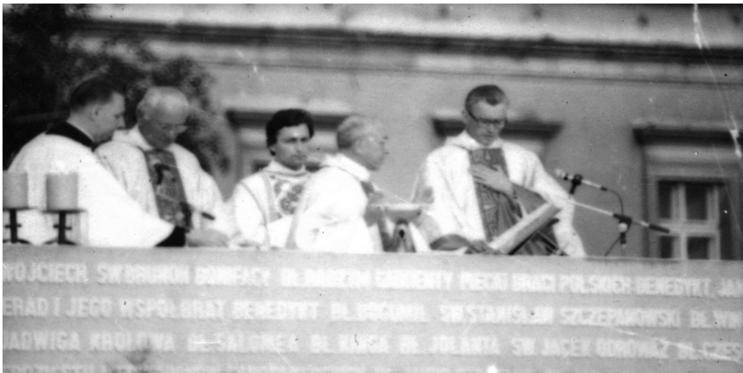
Uroczystości pogrzebowe, msze i modlitwy w intencji zmarłego prymasa polski ks. kard. Stefana Wyszyńskiego. Po środku kardynał Agostino Casaroli, pierwszy z prawej arcybiskup Franciszek Macharski, 31 maja 1981 r.

https://przystanekhistoria.pl/pa2/tematy/solidarnosc/43084,Kardynal-Franciszek-Macharski-1927-2016.html