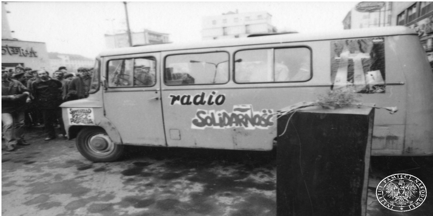
Akcja Radia „Solidarność” we Wrocławiu, 1981 r.

https://przystanekhistoria.pl/pa2/tematy/solidarnosc/61134,Sylwester-inny-niz-wszystkie.html