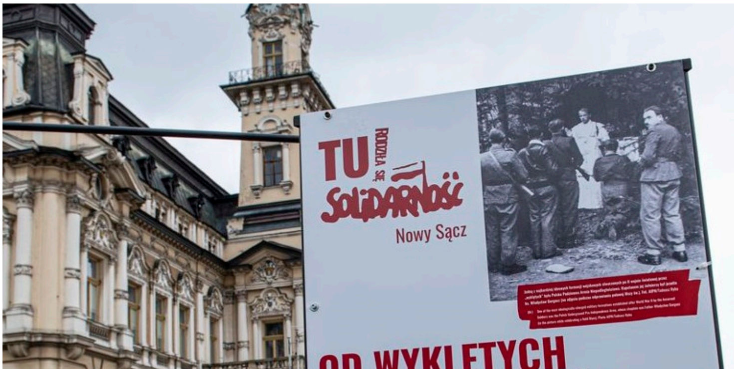
Wystawa „TU rodziła się Solidarność” w Nowym Sączu

https://przystanekhistoria.pl/pa2/tematy/solidarnosc/80095,Poczatki-niezaleznego-ruchu-zwiazkowego-w-Gorlicach.html