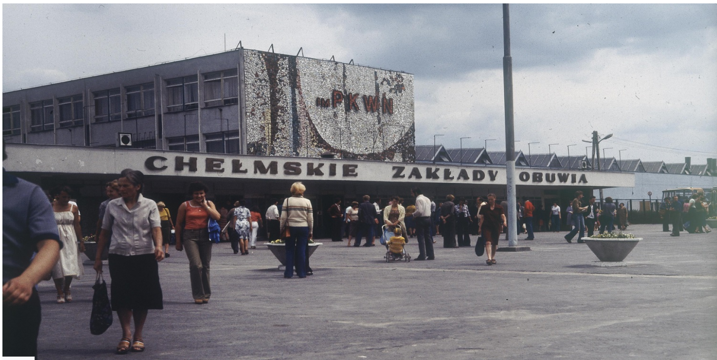
Chelmskie Zakłady Obuwia im. PKWN przy ulicy Wojsławickiej, 1979 r. Fot. NAC

https://przystanekhistoria.pl/pa2/tematy/solidarnosc/80107,Poczatki-Solidarnosci-w-Chelmie.html