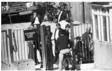
Brama Elbląskiego Przedsiębiorstwa Budownictwa Przemysłowego, 28 sierpnia 1980 r.