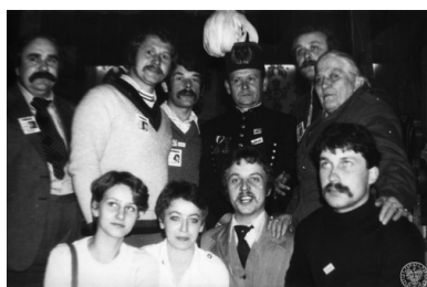
Delegaci na I Walne Zebranie Delegatów NSZZ 'Solidarność' Regionu Elbląskiego, 1981 r., ze zbiorów AIPN