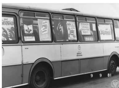
Autokar delegacji NSZZ 'Solidarność' Regionu Elbląskiego na parkingu przed halą Olivia w Gdańsku, 9 września 1981 r., ze