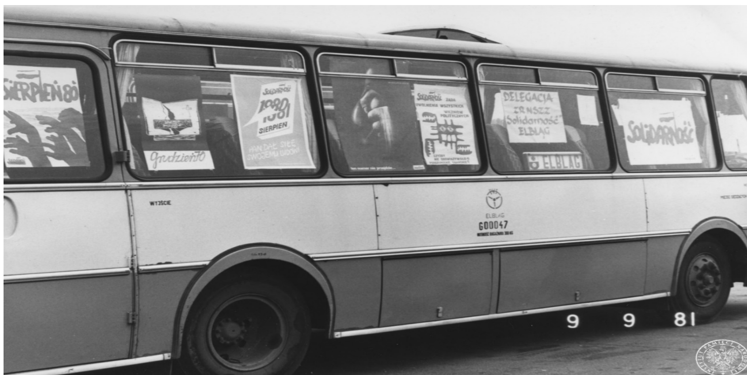
Autokar delegacji NSZZ 'Solidarność' Regionu Elbląskiego na parkingu przed halą Olivia w Gdańsku, 9 września 1981 r.

https://przystanekhistoria.pl/pa2/tematy/solidarnosc/80117,Karnawal-Solidarnosci-w-Elblagu.html