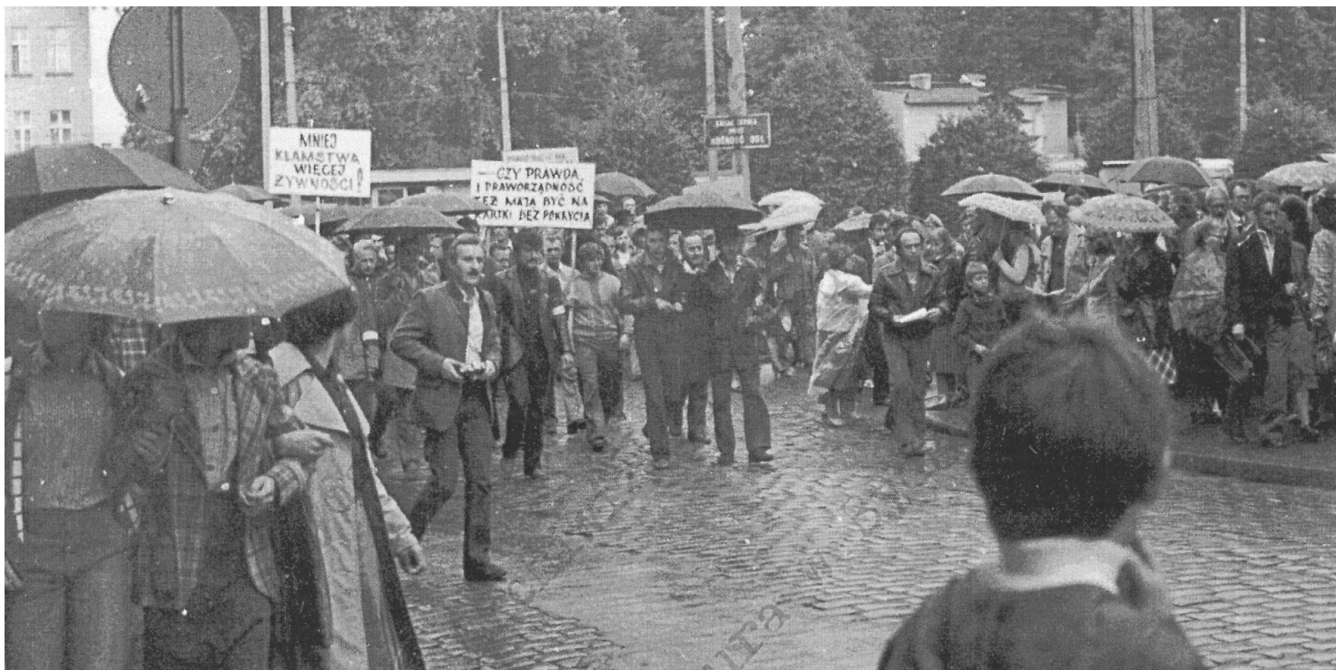
Przemarsz Protestacyjny z 31 sierpnia 1981 r. w Grudziądzu.

https://przystanekhistoria.pl/pa2/tematy/solidarnosc/80143,Grudziadz-na-mapie-opozycji-PRL.html