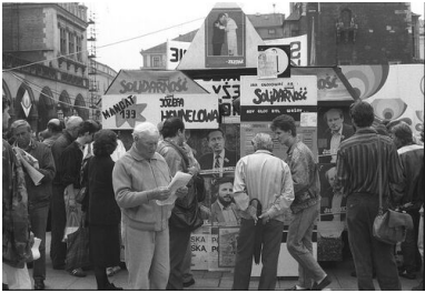
Wybory kontraktowe z 1989 r. w Krakowie.

U progu lata 1989 r. strona solidarnościowa nie potrafiła wykorzystać wielkiego mandatu zaufania społecznego. Nie zdecydowała się na odważne sięgnięcie po władzę. Trzeba też pamiętać, że część opozycji zbojkotowała wybory (m.in. „Solidarność Walcząca”, Polska Partia Socjalistyczna – Rewolucja Demokratyczna, Liberalno-Demokratyczna Partia „Niepodległość”, Polska Partia Niepodległościowa). Z kolei Konfederacja Polski Niepodległej, choć krytyczna wobec ustaleń okrągłego stołu, wystawiła jednak kandydatów w wyborach.