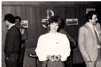
Spotkanie Komitetu Obywatelskiego „Solidarność” w Starachowicach.

parlamencie. Wokół takich założeń politycznych skupiła się duża grupa ludzi i to właśnie umożliwiło powstanie zorganizowanej struktury KPN-u w Kielcach.