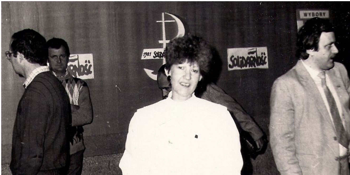
Fot. ze zbiorów Ewy Markowskiej

https://przystanekhistoria.pl/pa2/tematy/solidarnosc/83992,Zmagania-z-wladza.html