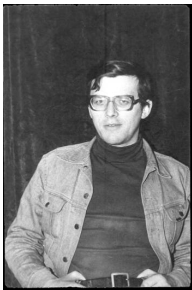
Jan Samsonowicz. Fotokopia z portalu IPN „Polskie miesiące” (polskiemiesiace.ipn.gov.pl) - część o Grudniu 1981