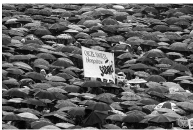
Wierni pod parasolami na mszy papieskiej na lotnisku Muchowiec w Katowicach. Druga pielgrzymka Jana Pawła II do Polski, 1983.