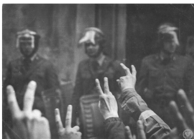
3 maja 1983 r., Warszawa, demonstracja NSZZ „Solidarność”.

Zjawisko historyczne, którym była w latach osiemdziesiątych polska Solidarność, miało strukturę trójwarstwową. Na poziomie najbardziej powierzchniowym, na pierwszym planie wydarzeń, był to związek zawodowy. Instytucja ta jednak z różnych powodów nie zrzeszała wszystkich Polaków utożsamiających się z jej misją, toteż podzielałam ogólnie przyjętą opinię, że Solidarność była – w swej głębszej istocie – ruchem społecznym, obejmującym nie tylko członków związku i ich rodziny, lecz także licznych sympatyków, nienależących do tej organizacji. Moim zdaniem istniał jeszcze trzeci poziom tego zjawiska – najtrudniej uchwytny, a zarazem podstawowy. W swojej najgłębszej warstwie Solidarność była międzyosobową relacją łączącą większość ówczesnego polskiego społeczeństwa, przejawiającą się w ludzkich postawach, decyzjach, działaniach i dziełach.