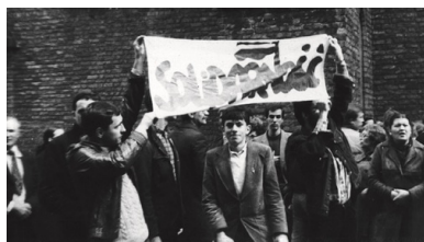
Demonstracja Solidarności przed katedrą św. Jana w Warszawie, 1 maja 1984 r.

Panowanie prawdy w działaniach ówczesnej Solidarności pozwoliło dojrzałe przeżywać wolność, której przyływ poczuliliśmy wtedy z radością i umiarkowaną nadzieją. Najważniejsza była wszakże odzyskana wolność wewnętrzna, nastąpiło bowiem duchowe przebudzenie narodu z niewolniczego poczucia geopolitycznego uwięzienia. I podobnie jak mądrość panowała nad głoszeniem prawdy, tak nad urzeczywistnieniem wolności panowała odpowiedzialność. Okazywało się, że wolność zawiera w sobie istotowe samoograniczenia, czyli jest najpełniejsza, kiedy panuje nad sobą, a granicą wolności osoby są dobro innych osób i dobro wspólne. Dlatego odzyskanie niepodległości czy też odsunięcie od władzy komunistów to były niewypowiedziane wprost marzenia, tymczasem zaś Solidarność skupiała się na osiągnięciu kompromisów w dziedzinie polityki społeczno-gospodarczej.