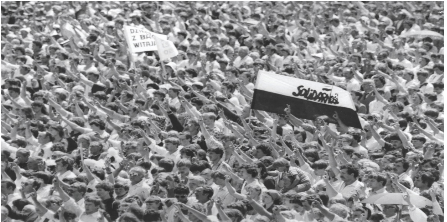
Druza pielgrzymka Jana Pawła II do Polski; Msza św. beatyfikacyjna m. Urszuli Ledóchowskiej, Poznań, 1983 r.

https://przystanekhistoria.pl/pa2/tematy/solidarnosc/85631,Solidarnosc-relacja-miedzyosobowa.html